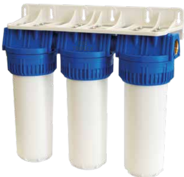
Contenitore per cartucce serie FP3 Triplex testa inserto ottone vaso opaco bianco FP2 Triplex filter cartridge housings with brass inserts and opaque white sump