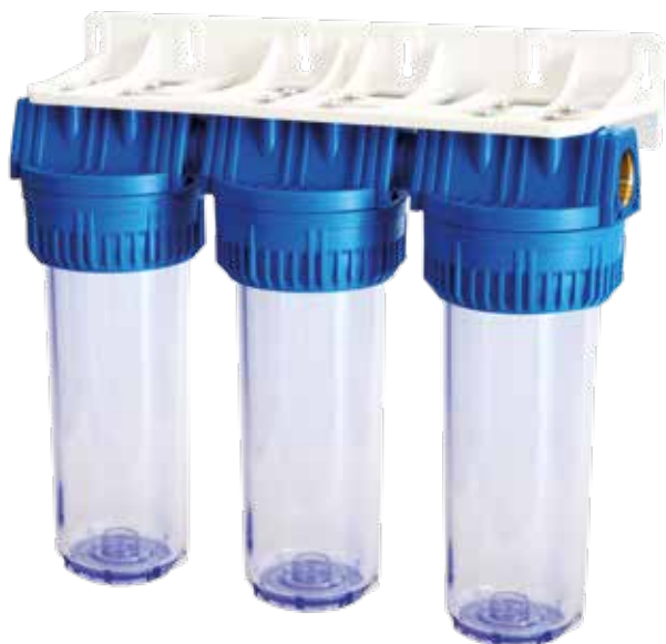
Contenitore per cartucce serie FP3 Triplex testa inserto ottone vaso SAN trasparente FP3 Triplex filter cartridge housing with brass inserts and transparent SAN sump